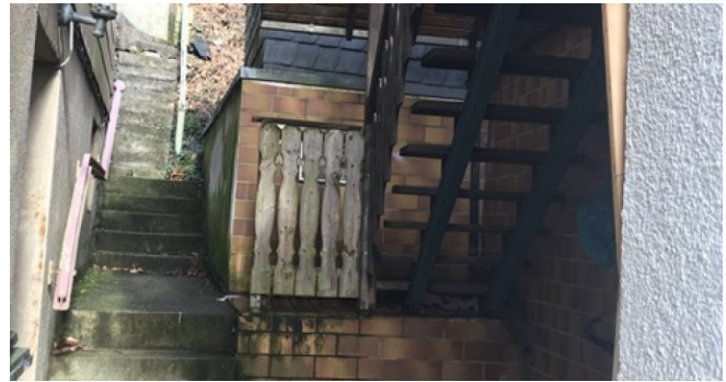
Treppenaufgang zum EG