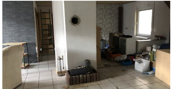
Wohn-/ Esszimmer EG