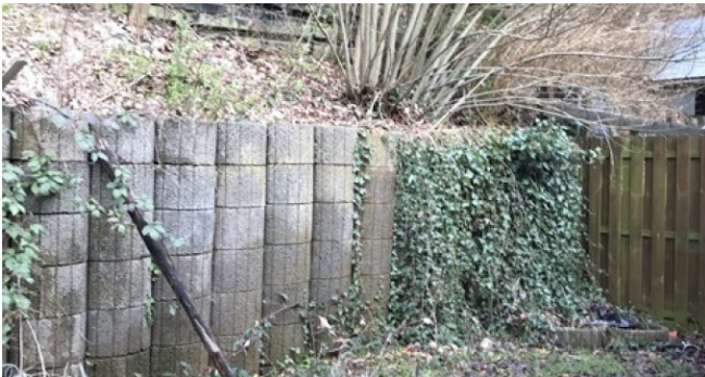
Terrasse/ Garten EG