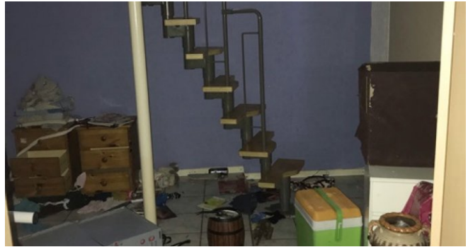
Treppe vom UG zum EG